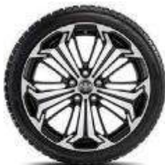
Комплект зимни гуми Continental с алуминиеви колела 19" TMEWA42092AY