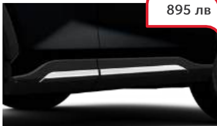
Странични хромирани лайстни за вратите PW1564200001