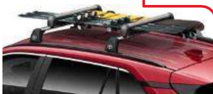
Държач за ски/сноуборд Mid 6 PW4030063600

Изключително широки, лесни за използване държачи за ски за 5 до 6 чифта ски (в зависимост от размера на скиите) или 4 сноуборда. Скиите / сноубордовете са здраво закрепени между 2 гумени профила, които ги предпазват.