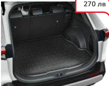
Гумена стелка за багажник PW24142001

Твърда водоустойчива гумена стелка с ръбове за защита на багажника