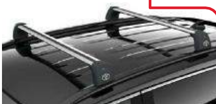
Напречни рейки за багажник PW30142000

Напречните рейки се застопоряват върху релсите и образуват сигурна основа за широк спектър от прикачени пособия