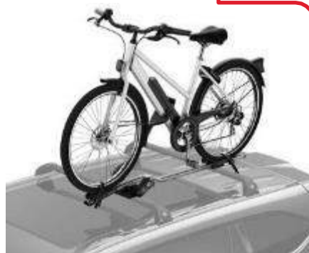
Държач за велосипед PW308000007

Държачът за велосипед ви позволява безопасно да транспортирате велосипеди на покрива на автомобила. Велосипедните колела влизат в профила, което позволява на велосипеда стои в изправено положение.