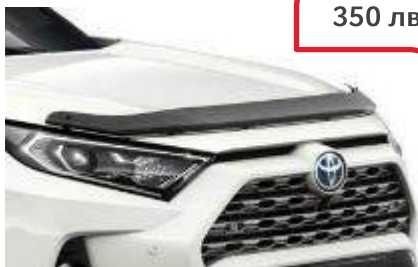
Дефлектор за преден капак PZQ1542130

Проектиран така, че да съответства на аеродинамичните контури на вашето превозно средство и да отклонява въздушния поток, той също така осигурява на вашето превозно средство допълнителен слой защита, който помага да се предпази капак на автомобила от малки удари и ожулвания.