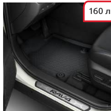
Гумени стелки PW2100R027