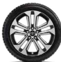
Комплект зимни гуми Bridgestone с алуминиеви колела 18" TMEWA42138DY